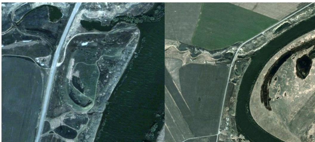
Вид на Андреево городище со спутника.

Ниже мы приводим снимки со спутника «Андреева городища», фрагмент географической карты и полный текст документа, в котором упоминается «Андреево городище».